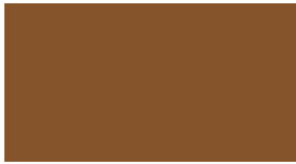
DIC-N772 煙草色 (たばこ)