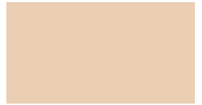
DIC-N780 薄香色 (うすこう)