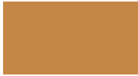
DIC-N768 狐色 (きつね)