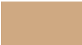
DIC-N786 亜麻色 (あま)